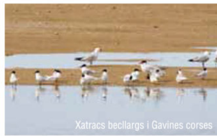
Xatracos becllargs i Gavines corses