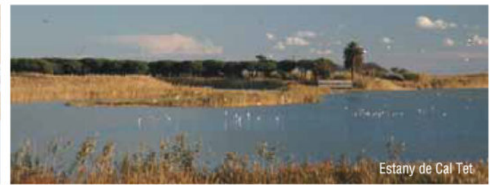
Estany de Cal Tet

Quan sortim de l'aguait i ens dirigim cap a la sortida, passem per zones amb vegetació interessant, com les jonqueres i els salats adaptats a la inundació temporal i a la presència de sals, o els prats humits , mantinguts mitjançant desbrossades manuals, o la pastura de ramats. Aquests prats, quan estan inundats, són molt atractius per als ocells limícoles.