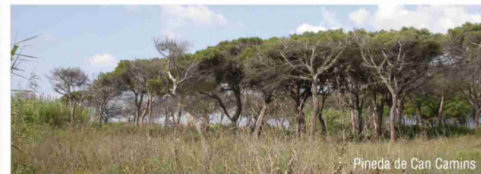
Pineda de Can Camins