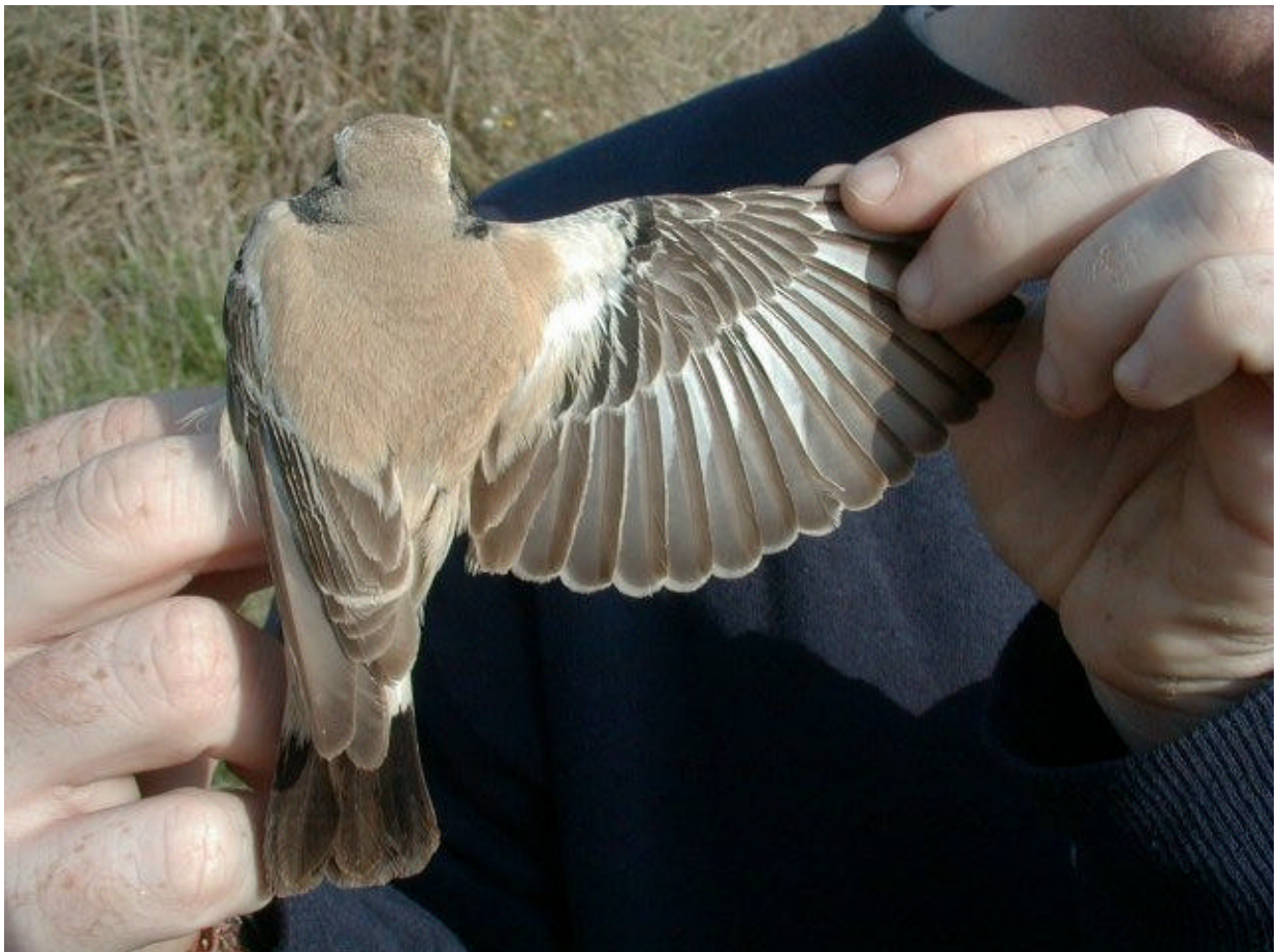
El Còlit del desert (O. deserti) anellat al delta: l'ocell més rar d'aquest hivern.