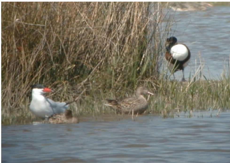
Xatrac gros a la maresma, amb un collverd i un ànec blanc

Sampere). 2 exs. a la platja del Prat el 6.IV (XLBA, JBDA, JJMA); darrera citació de pas prenupcial.