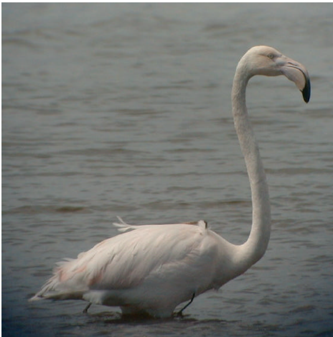
Flamenc rosa Phoenicopertus roseus a la maresma de les Filipines l'11 d'abril de 2003