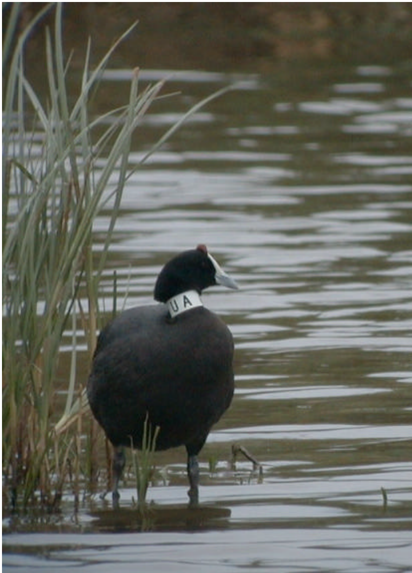
Una de les fotges banyudes alliberades a la RN Remolar-Filipines fotografiada des de l'aguait de la maresma