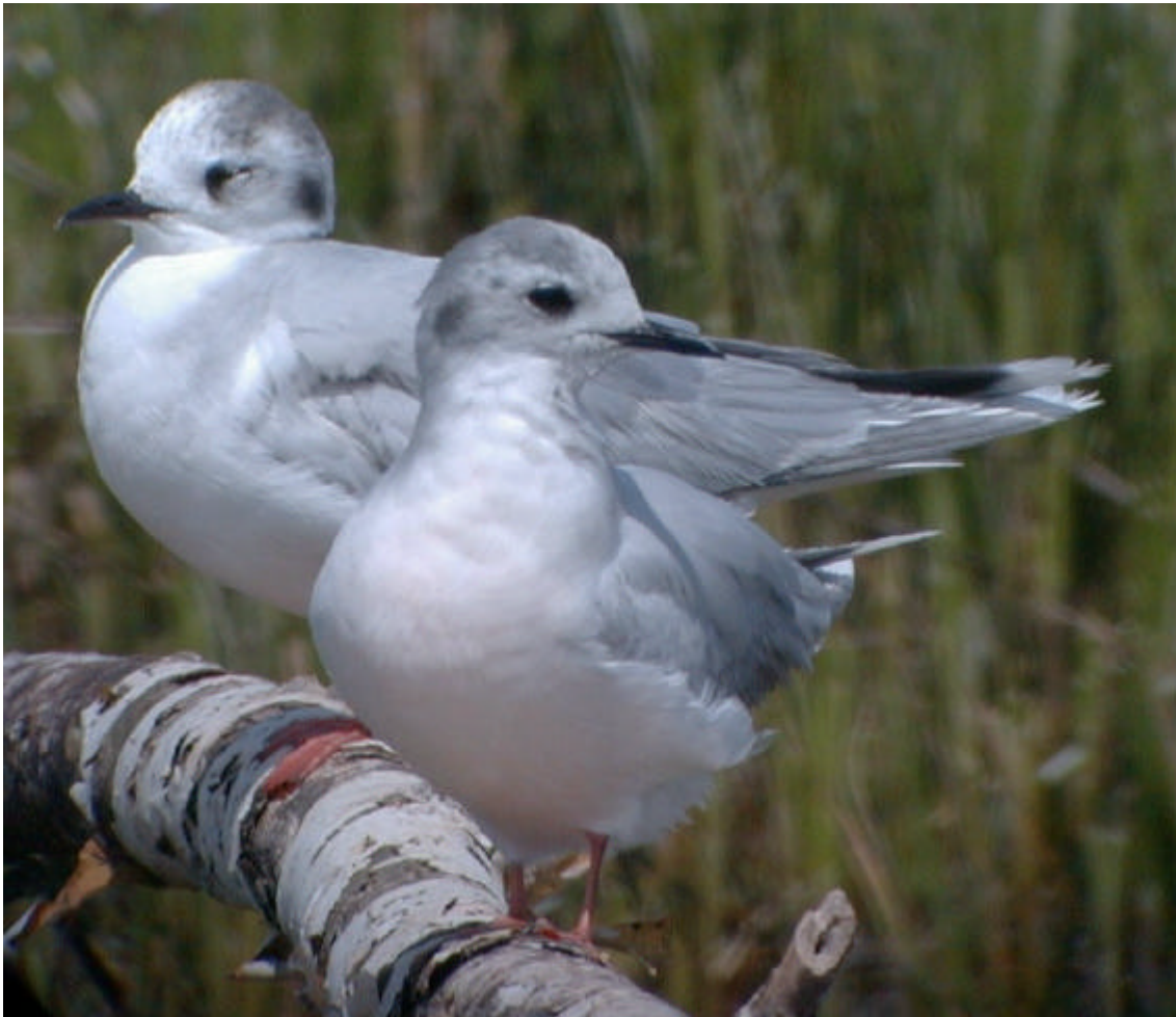
Gavines menudes a la maresma, des de l'aguait de la maresma

Gavina Cendrosa Larus canus : 1 ex. adult al camí de València el 3.III (FLSA, I. Valls, V. Sanz).