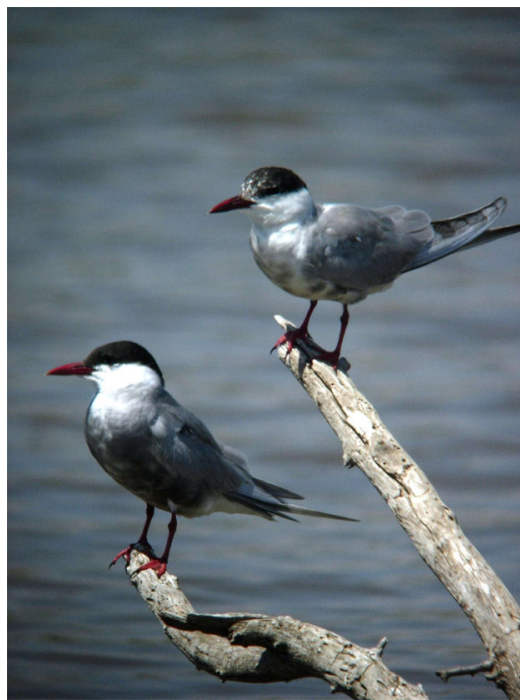
Fumarell carablanc just davant l'aguait de la maresma del Remolar.

Fumarell carablanc Chlidonias hybrida : 12 exs. a la maresma el 5.VI (ARMC). 2 exs. a la maresma el 18.VI (FLSA). 8 exs. a la maresma el 26.VI (ARMC).