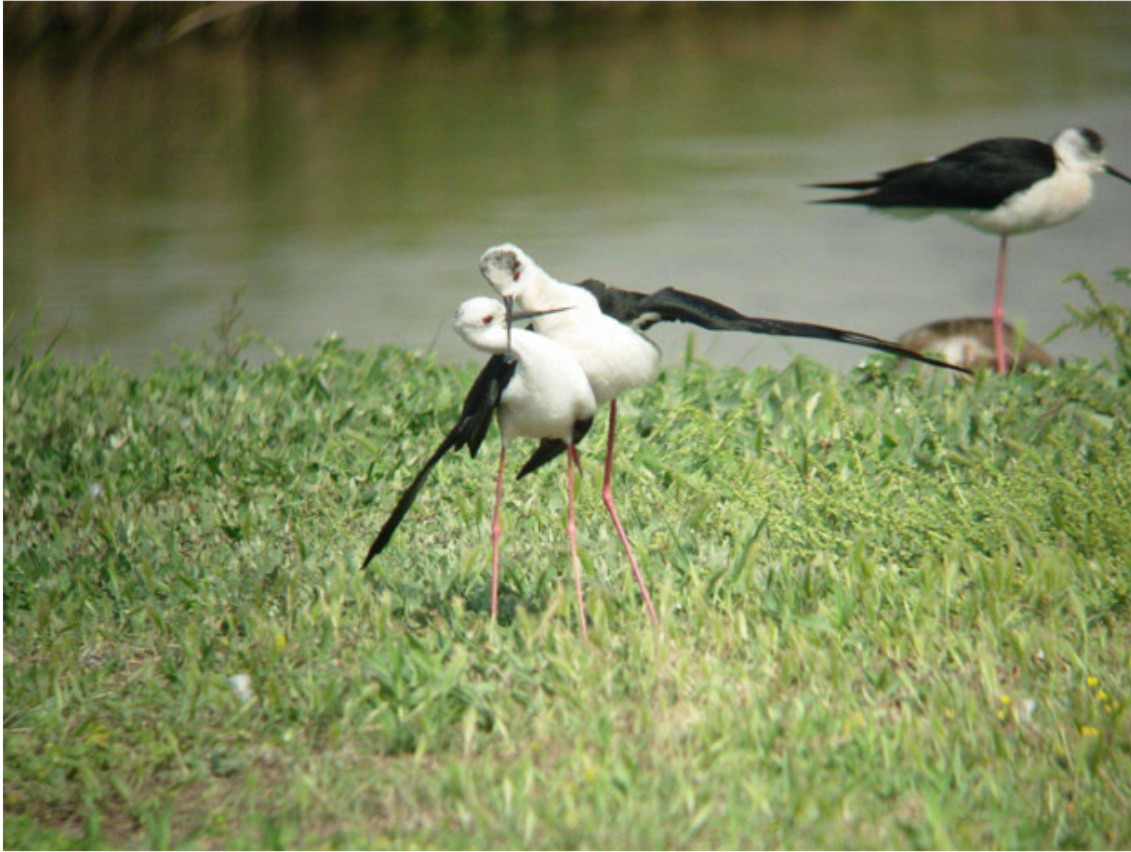
Parella de Cames llargues en una de les illetes de la maresma del Remolar

Bec d'alena Recurvirostra avosetta : 1 ex. a la maresma el 3.V (FLSA, X. Sampere) fins el 5.V (X. Sampere). 3 exs. a la maresma el 9.V (FLSA). 3 exs. a la platja de ca l'Arana l'11.V (FLSA). 4 exs. al "camp de futbol" el 22.V (X. Sampere) fins el 25.V (ARMC); darrera citació de pas prenupcial. 1 ex. a la maresma el 20.VI (FSEB); 1ª citació de pas postnupcial.