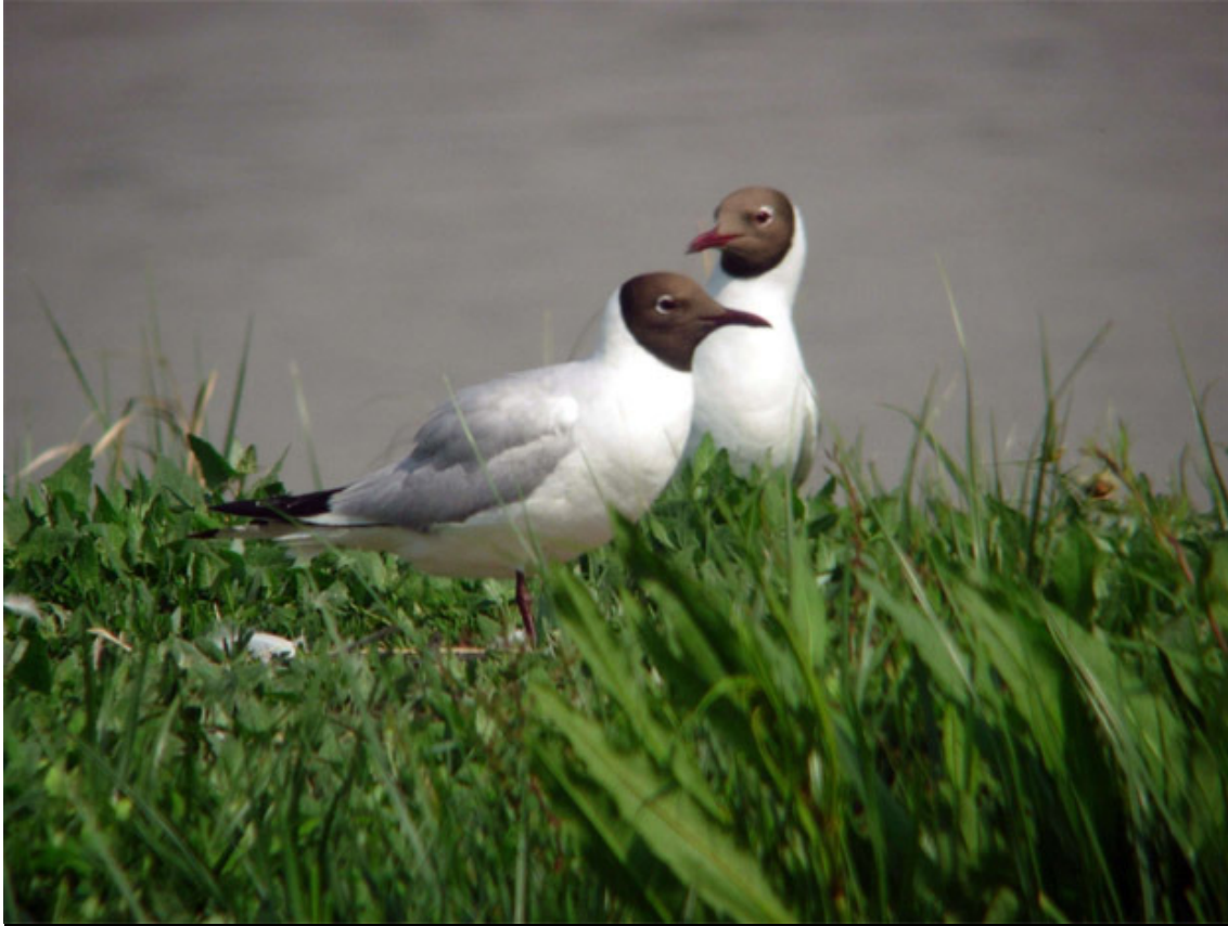
La parella de Gavina vulgar que va estar covant durant el mes de maig a l'illa de la maresma del Remolar (Ricard Gutiérrez).

Gavina capblanca Larus genei : 2 exs. a ca l'Arana i cal Tet el 13.V (RGBA) fins el 20.V (FSEB, X. Sampere); darrera citació de pas prenupcial.