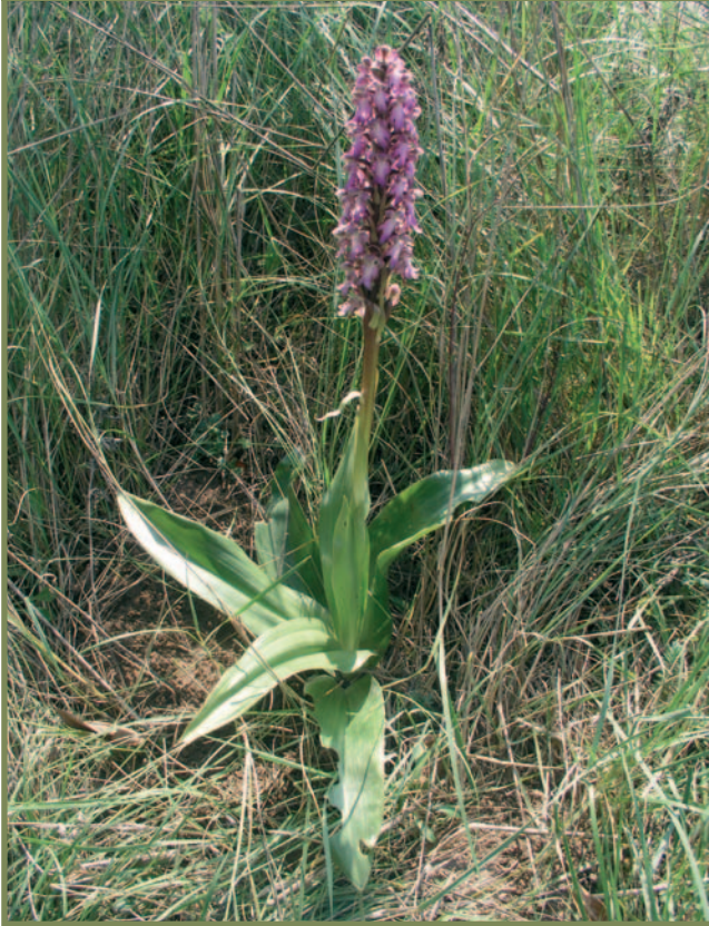
Fotografia 1: Aspecte general de la planta i inflorescència Picture 1: General aspect of the plant and inflorescence