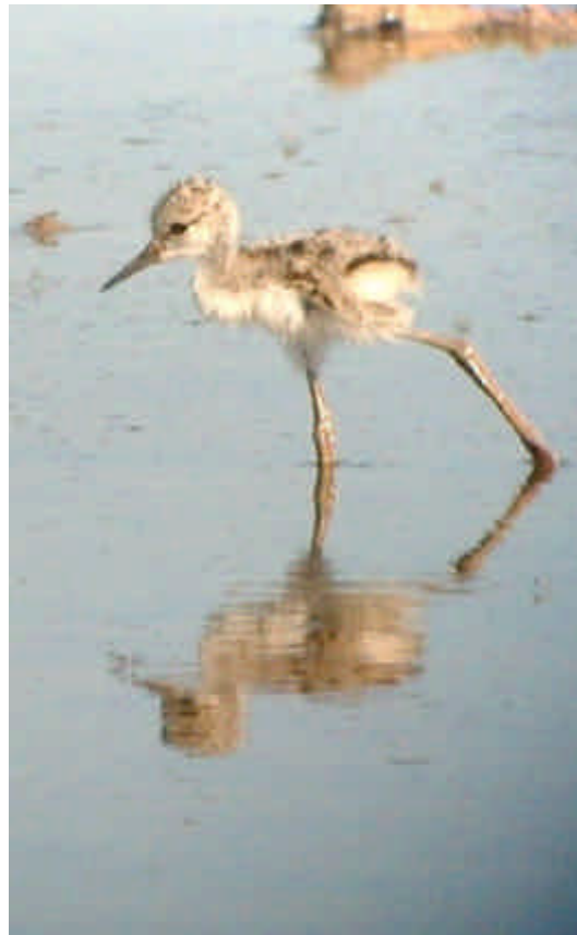
Poll de cames-llargues ( H.himantopus ) a la maresma

Cames Llargues Himantopus himantopus : Nidificant. Menys de 100 parelles crien a la maresma de les Filipines (RGBA): n° total encara per confirmar. 1 parella amb 4 ous a la maresma el 9.05 (EGPA, V. Lomeña); 1ª observació de polls de l'any.