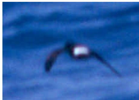
Ocell de tempesta ( Hydrobates pelagicus). Costa del Llobregat, 25.05.2001

Ocell de Tempesta Hydrobates pelagicus : 7 exs. davant les costes del Garraf més 2 exs. davant el litoral deltaic entre 3 i 4,5 milles nàutiques el 25.05 (FSEB, FLSA, RGBA, JCMC).