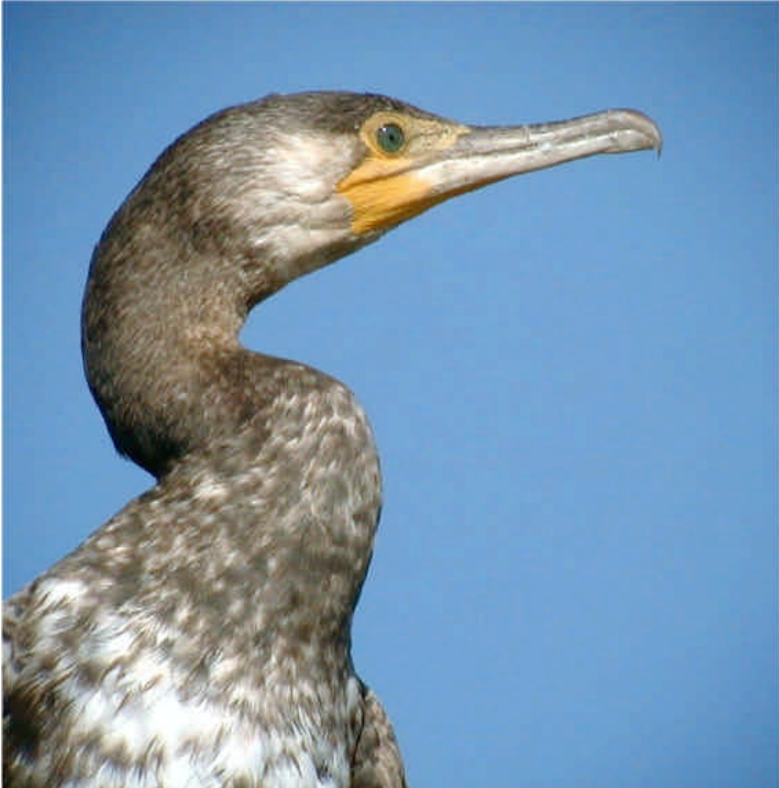
Corb-mari gros ( Phalacrocorax carbo ) de segon estiu a la Bassa dels Pollancrez