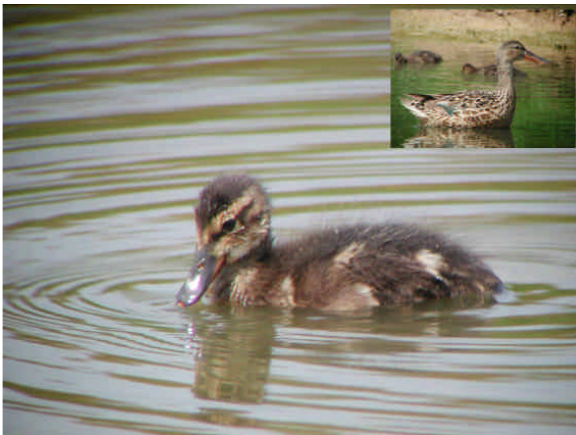
Poll d'ànec cullerot ( Anas clypeata ). Maresma de les Filipines. La femella (inset) es veia davant l'aguait de la maresma.

Morell Cap-roig Aythya ferina : 2 parelles ha niat a la Vidala (FSEB). 1 ex. femella amb 4 polls a la Vidala els dies 20.05 (FSEB) i 23.05 (FSEB, FLSA). 2 exs. femelles amb 5 i 3 polls a la Vidala el 17.06 (ARMC). 1 ex. mascle a la llacuna de la Ricarda el 22.06 (RGBA, EGPA).