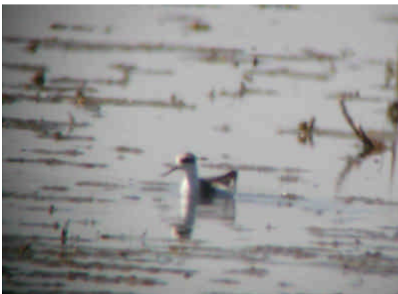
Escuraflascos bec-fi ( Phalaropus lobatus) a la maresma de les Filipines, prop la Vidaleta, el 19.5.2001