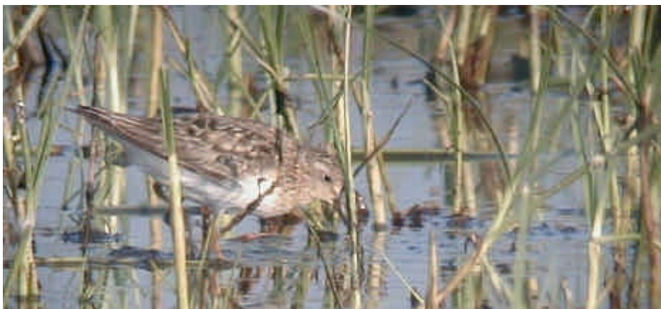
Territ de Temminck adult ( Calidris temminckii ) a la maresma de les Filipines el 7.8.2001

Remena-rocs Arenaria interpres : 1 ex. a la maresma el 10.08 (JSPC); primera citació de pas postnupcial, fins el 14.08 (RGBA, FLSA, ASSA, ARMC).