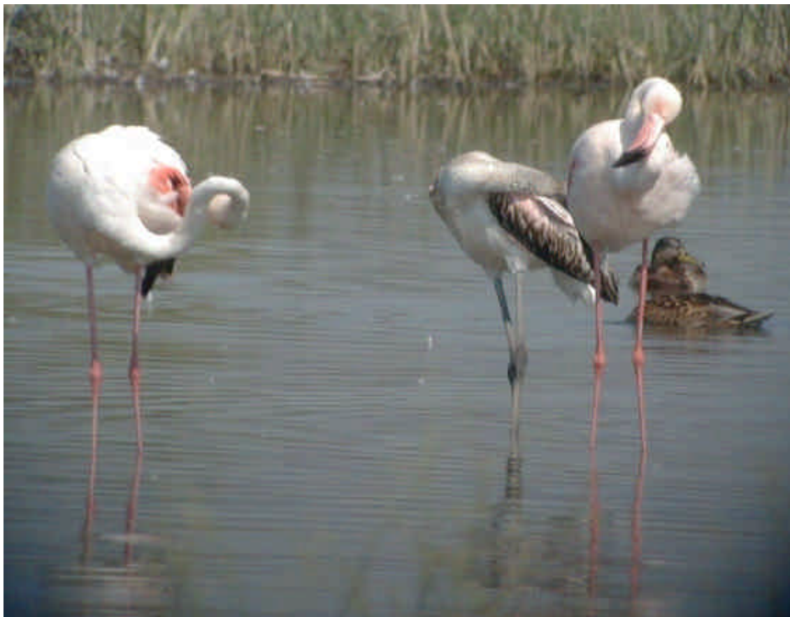
Part del grup de flamencs present al delta des del juliol. Gràcies a la presència d'exemplars anellats, sabem que alguns d'ells han 'repetit' i són els mateixos detectats l'any passat. A més, s'estan observant amb freqüència al riu Llobregat entre Sant Boi i el Prat de Llobregat Agost 2001.

Flamenc Phoenicopterus ruber : 1 ex. a la maresma entre el 8.07 (ARMC) fins el 22.07 on s'afegeix un 2on ex. (ARMC) fins l'1.08 (FLSA). 3 exs. a la bassa dels Pollancrel el 2.08 (FLSA) fins el 9.08 (RGBA). Observació de diferents exs. a la maresma fins a finals del mes d'agost amb un màxim de 15 exs. el 31.08 (FLSA). Cal mencionar que dos dels exs. vistos a la maresma duian anella PVC: DNTX (taronja) i OBXD.