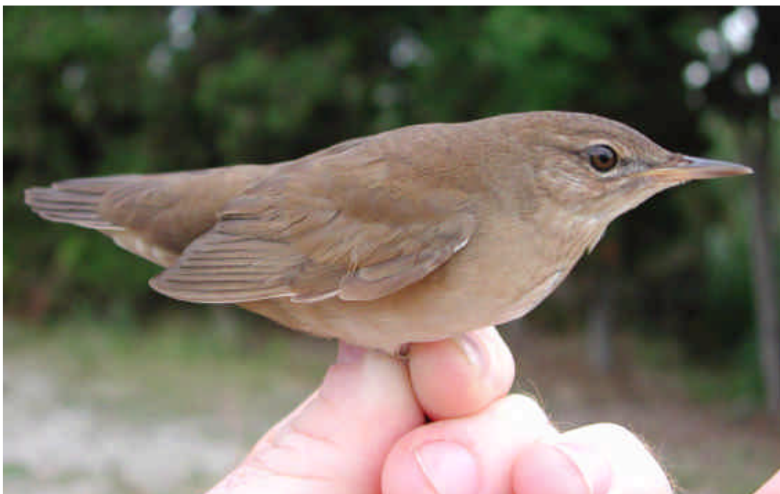
El primer boscarler comú ( Locustella luscinioides ) del pas tardoral de 2001

Mosquiter de Passa Phylloscopus trochilus : 1 ex. al camp de futbol el 12.08 (ARMC); primera citació de pas postnupcial.