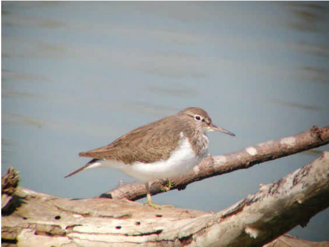
Xivotona ( Actitis hypoleucos ) a la maresma de les Filipines. Agost 2001.