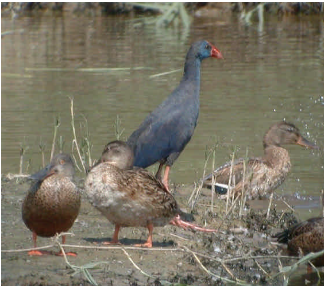
Polla blava (Porphyrio porphyrio) en companyia de dos coll-verds (Anas platyrhynchos) i dos cullerots (Anas clypeata) a la bassa dels Pollancrez

Fotja Vulgar Fulica atra : Nidificant abundant.