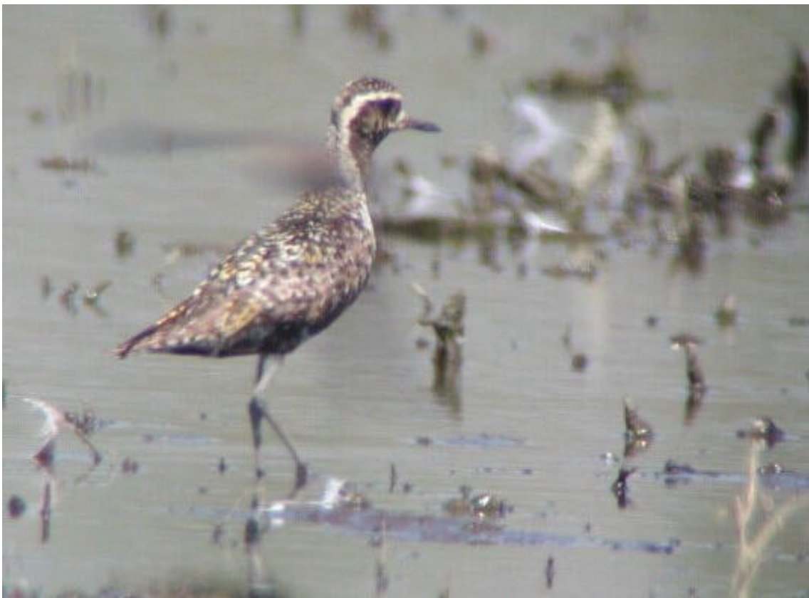
Dues imatges de Daurada Petita del Pacífic ( Pluvialis fulva ) probablement de primer estiu, citada a la maresma de les Filipines. Són diagnòstics la llargària de les potes, aspecte general, proporcions del cap, bec i disseny de parts superiors.