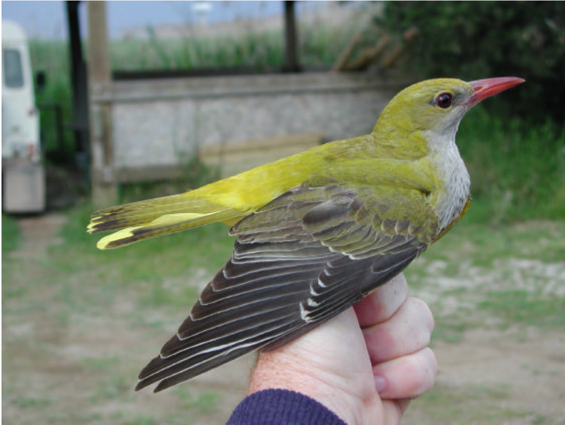
Un Oriol femella ( Oriolus oriolus ) anellat. Aquesta espècie continua niant en petit nombre a les arbredes de la reserva natural.