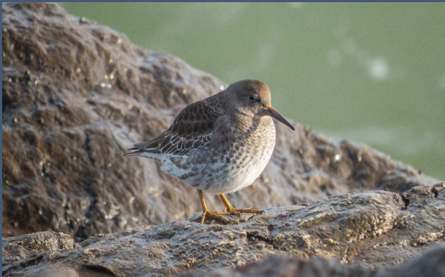
Territ fosc ( Calidris maritima ) a la gola de la riera de St. Climent el 03.02.2018.