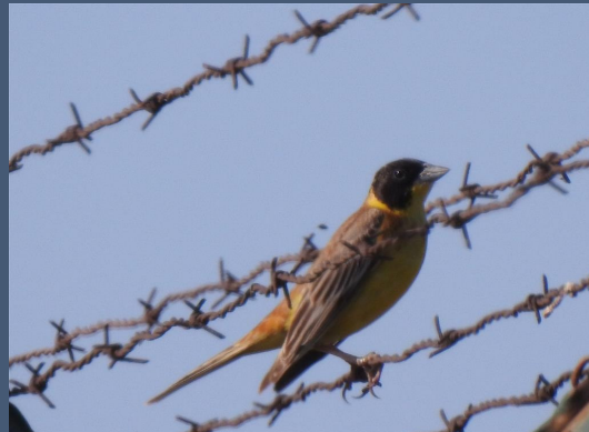
Sit capnegre ( Emberiza melanocephala ) a l'aeroport de Prat-Barcelona el 25.06.2018.